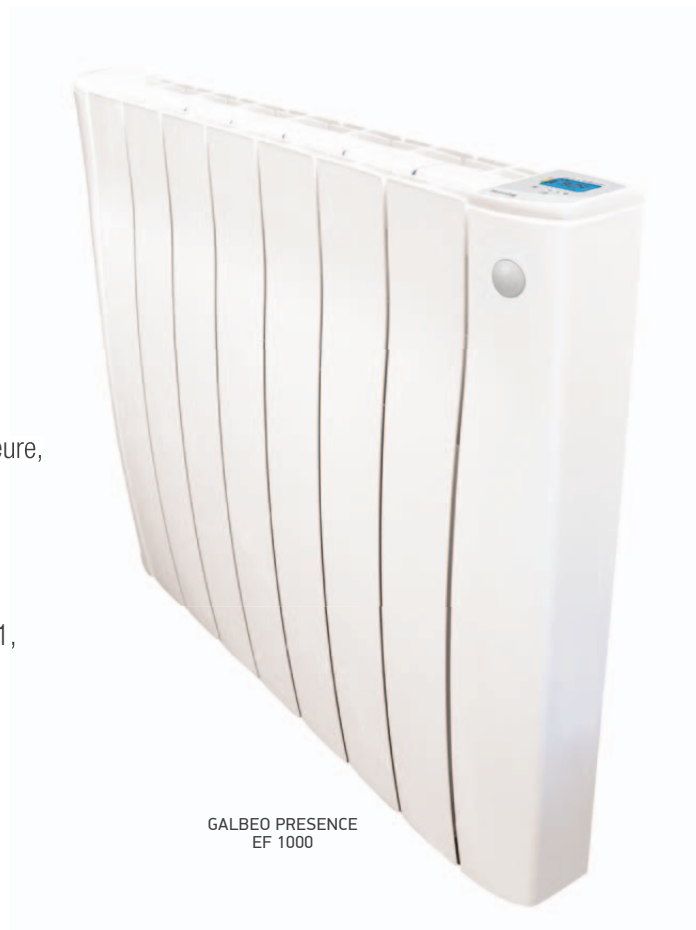
GALBEO PRESENCE EF 1000