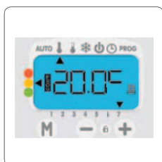
Affichage de la consommation énergétique estimé en temps réel: