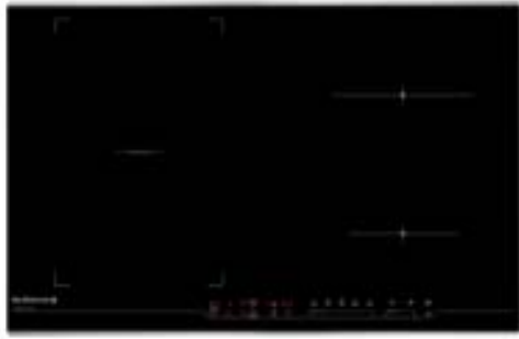
Table de cuisson