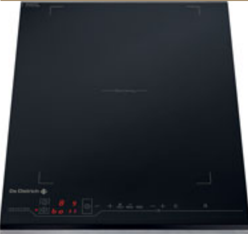
Table de cuisson