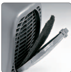
Filtre à air anti-poussières lavable