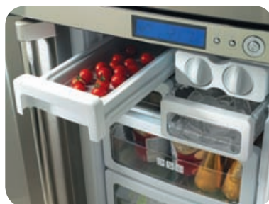
Double bac «Congélation Express» et «Twist Ice Cube Maker»