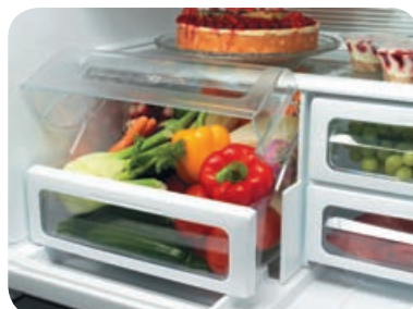
Tiroirs marqués de pictogrammes pour un meilleur emplacement des aliments